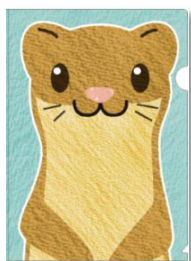
クリアファイル 各種¥200 A4サイズ