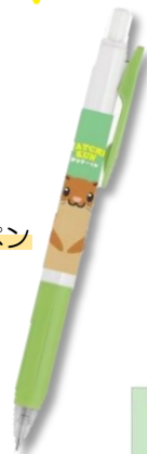
ボールペン (黒) ¥200