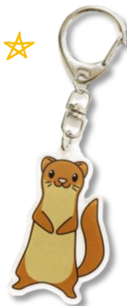
キーホルダー ¥300 全長6cm