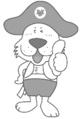
(公財)横浜市体育協会イメージキャラクター キャプテンわん