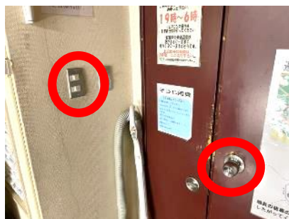
スイッチ類・ドアノブ