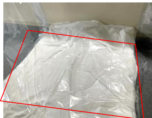
③ シーツと掛け布団の間（頭側）にビニールシートを敷く