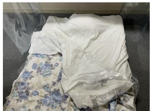
④ 完成 * 上半身のみビニールシートに挟まれる形になります。