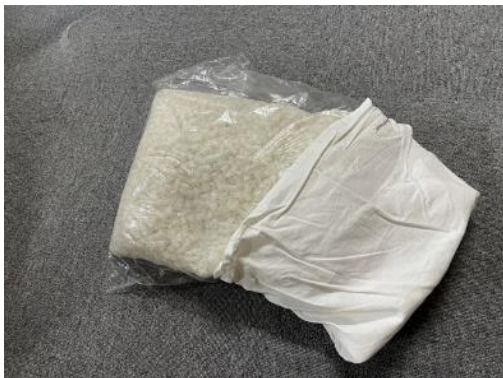
① 枕をビニール袋に入れ、枕カバーを付ける。 * 枕のみ 3 日間開く場合も行います。