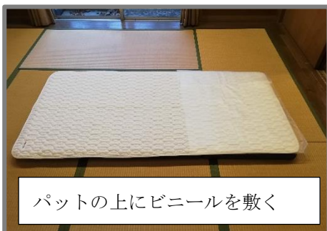
パットの上にビニールを敷く