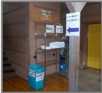
貸出し・返却場所

返却は、退所日にシーツと枕カバーを別々のビニール袋に使用者本人が入れ、まとめて貸出し場所までお持ちください。感染リスクを避けるため、シーツ・枕カバーは通常の畳み方でなくても結構です。