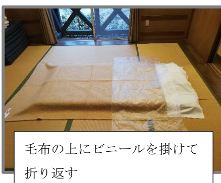
毛布の上にビニールを掛けて折り返す