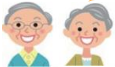
アンケートお客様の声より