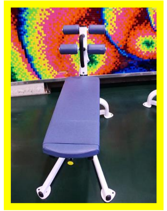
①リカンベントバイク ②アップライトバイク ③クランチベンチ