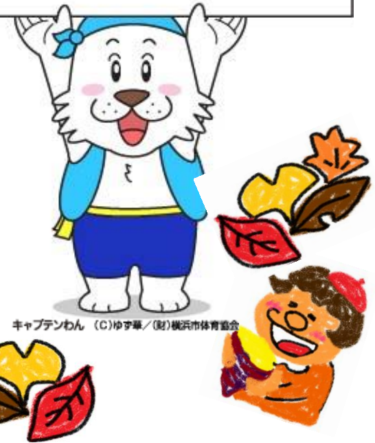
キャプテンわん

○教室に関するお問合せにつきましては下記までご連絡ください。 三ツ沢公園青少年野外活動センター (TEL: 045-314-7726) http://www.yspc.or.jp/mitsuzawa_yc_ysa/