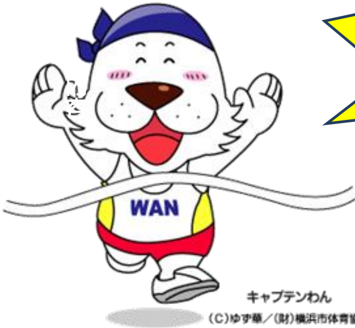
キャプテンわん (C)ゆず華/(財)横浜市体育協会

参加された方には自宅で行える 「身体をじょうずに動かすため のストレッチ方法」のプリントを お渡しします!