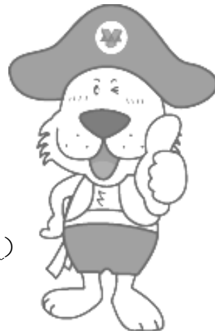
(公財)横浜市体育協会イメージキャラクター キャプテンわん