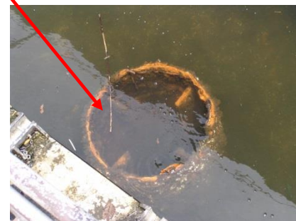
撤去した支柱の残部