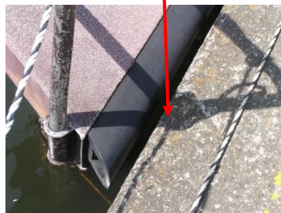
台船の渡り部分 川側に傾斜