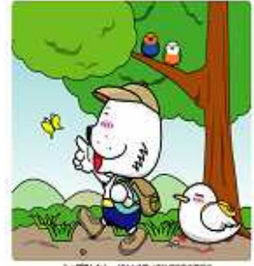
キャプテンわん (C) ゆず華 / (財) 横浜市体育協会

登山やハイキングを安全で楽しいものとするための机上講習と横浜山岳協会の加盟団体のベテランリーダー達(山岳指導員)が同行する、 八海山(百名山、NHKの天地人のタイトルバックの山) での初心者対象の登山教室です。ご参加をお待ちしております。